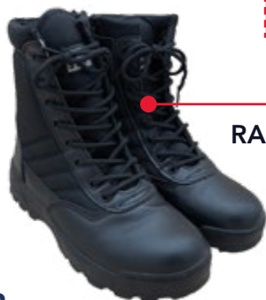
RANGERS SWATT JEUNES SAPEURS-POMPIERS Réf : RGFEVELT