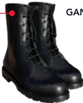
GANTS CUIR HYDROFUGE AVEC MANCHETTE Réf : GTJSP3