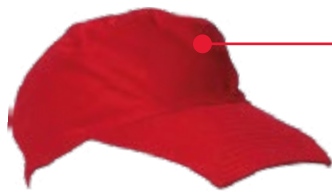
CASQUETTE JEUNES SAPEURS-POMPIERS Réf : CJSP