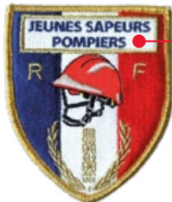
ÉCUSSON BRODÉ JEUNES SAPEURS-POMPIERS Réf : ECJSP